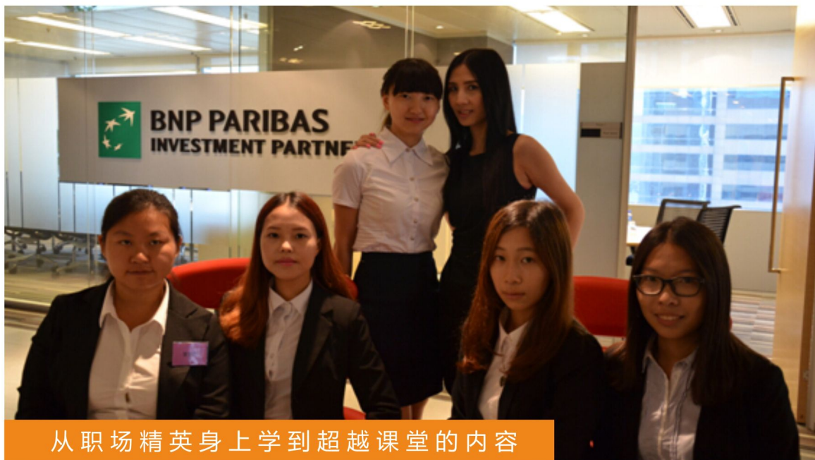
从职场精英身上学到超越课堂的内容