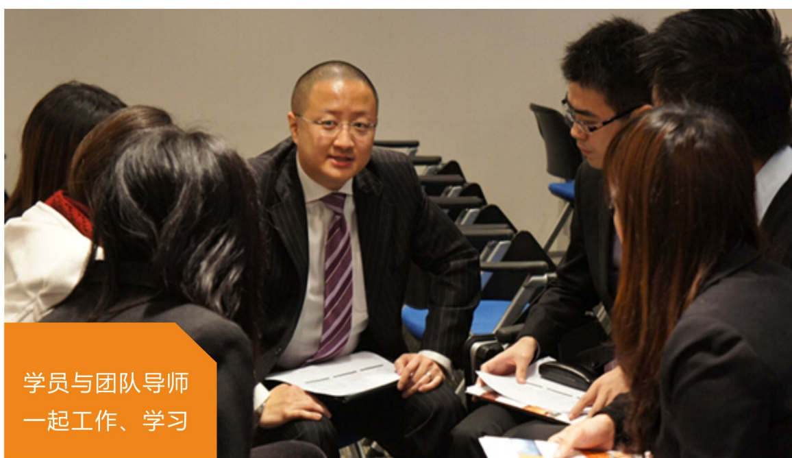
学员与团队导师 一起工作、学习