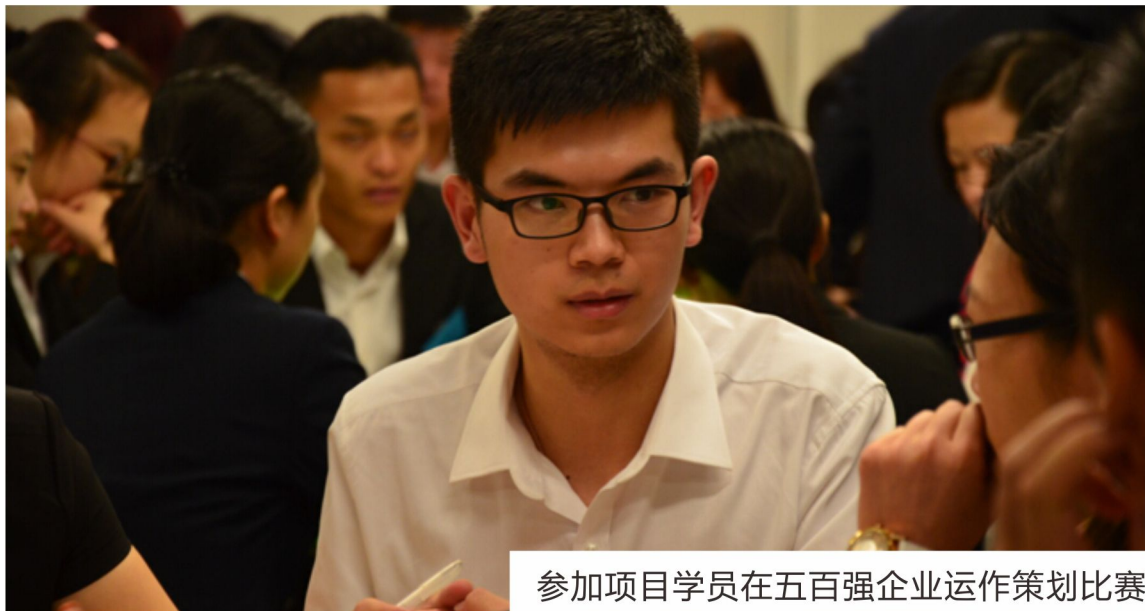
参加项目学员在五百强企业运作策划比赛

在一周内，每个团队在公司期间要参与以团队为单位的环球基金投资大赛。团队需要模拟管理个人、企业财富，在给定市场信息下以团队运作自己的基金。包括：环球经济数据发福，投资战略分析，决策制定，基金运作等环节。团队顾问和公司导师都会对参赛团队进行一定的指导。